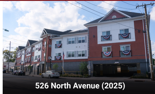
526 North Avenue (2025)