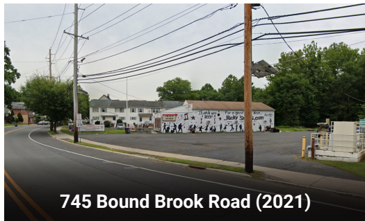
745 Bound Brook Road (2021)