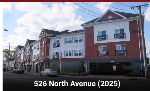
526 North Avenue (2025)