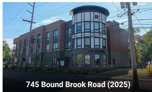
745 Bound Brook Road (2025)