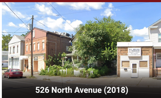
526 North Avenue (2018)